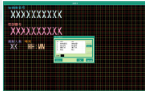
表示位置設定画面